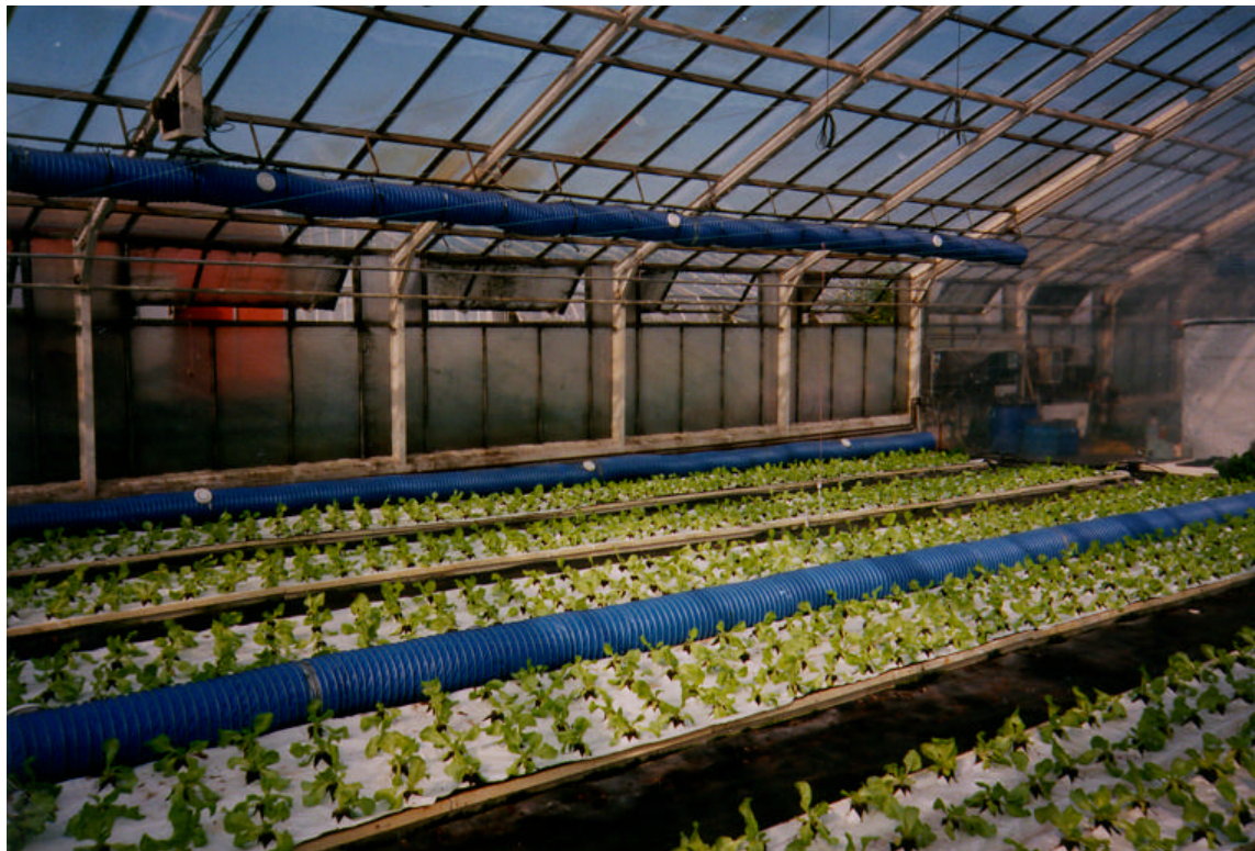
Abb. 2: Gewächshauszelle mit Beetanlagen nach dem plant-plane-Verfahren

Als Anbauverfahren wurde eine Variante des substratlosen Anbaus in folienbedeckten nährstoffdurchströmten Vliesmatten, das sogenannte Plant-Plane-Hydroponik-Verfahren ausgewählt. Es ermöglicht einen rationellen, kostengünstigen Betrieb und ist für ein breites Einsatzspektrum von Pflanzkulturen geeignet (SCHRÖDER, 1991). Bei diesem Verfahren werden Substratwürfel mit den Nutzpflanzen auf ein Vlies aufgestellt. Die beiden Gewächshauszellen wurden dabei mit je 5 Beeten ausgestattet. Als Testpflanze wurde Salat eingesetzt. Diese Pflanze ist eine gartenbaulich typische Kultur. Sie ist im mehreren Umtrieben in Kurzkultur anbaubar und stand daher für mehrere Durchgänge unter verschiedenen Kultivierungs- und Kompostierungsbedingungen zur Verfügung. Wesentlich ist weiterhin die bekannte gute Reaktion auf eine CO 2 -Düngung, so daß sich hier entsprechende Effekte leichter nachweisen lassen (GEISSLER, 1988, S. 143). Eine Gewächshauszelle zeigt Abb. 1.