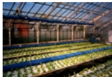
Gewächshauszelle mit Begasungsschläuchen für CO 2 -angereicherte Abluft aus dem Kompostprozeß

Das Verfahren wurde in einem vom Bund und Land geförderten Kooperationsprojekt in einem Gewächshaus erfolgreich erprobt. In der Versuchsanlage wurden Ertragszuwächse von 18% erzielt; während gleichzeitig 6% des Energiebedarfs eingespart wurden. Nach Abschluß des Vorhabens wird das von der GTS mitentwickelte Verfahren nun im großtechnischen Maßstab angewandt.